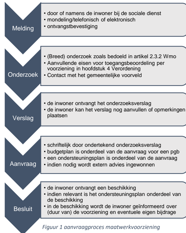
Figuur 1 aanvraagproces maatwerkvoorziening

In deze onderzoeksfase, als het gaat om een lichte ondersteuningsbehoefte of dienstverlening (individuele begeleiding, dagbesteding, huishoudelijke ondersteuning en/of logeeropvang) neemt de consulent contact op met het sociaal team voor de verkenning van (deel)mogelijkheden in het voorliggend veld. Dit is opgenomen als extra bepaling voor deze voorzieningen in hoofdstuk 4 van de Verordening. In