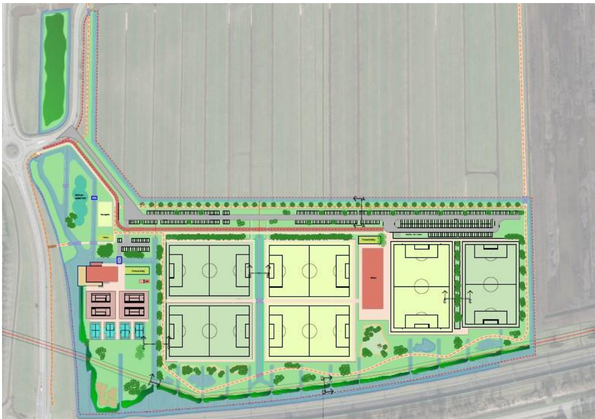
Afb 1. Ontwerp Sliedrecht Buiten

Door project Sliedrecht Buiten nemen de recreatiemogelijkheden in Sliedrecht toe, zodat elke inwoner de kans heeft om gebruik te maken van moderne sportfaciliteiten. Daarnaast ontstaat er op de plek van de huidige sportvelden ruimte voor nieuwe bedrijvigheid.